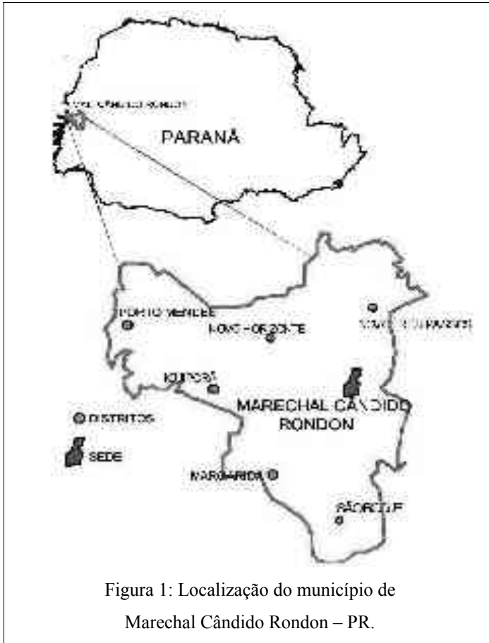
Figura 1: Localização do município de Marechal Cândido Rondon – PR.

A vertente estudada, denominada de topossequência de solos Frentino, mede 660 metros de extensão e está localizada na margem direita do trecho superior do córrego Guavirá, o qual tem a nascente próxima ao perímetro urbano da cidade.