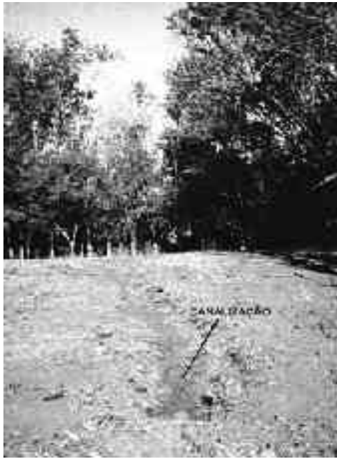
Figura 3: Canalização de água e evidências de pisoteio do gado

5YR 3/3 (bruno-avermelhado-escuro) e na base é de cores variegadas (amarelo, alaranjado, acinzentado), com predomínio da cor 7,5YR 4/3 (bruno). Em profundidade, o material transiciona por interpenetração para a rocha alterada e é, nessas condições, que o mesmo se encontra hidromorfizado. Predomina a textura argilosa, a estrutura granular e a consistência plástica e ligeiramente pegajosa.